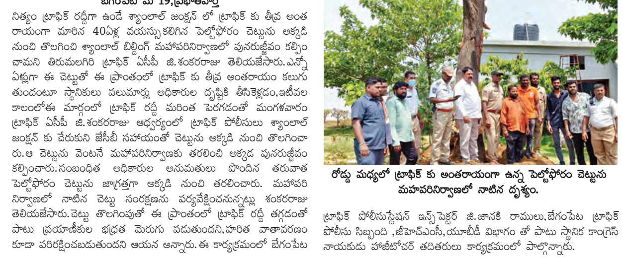
రోడ్డు మధ్యలో ట్రాఫిక్ కు అంతరాయంగా ఉన్న పెల్టోఫోరం చెట్టును మహాపరినిర్మాణంలో నాణీన దృశ్యం.

-మహాపరినిర్మాణంలో పునరుజ్జీవం. -తిరుమలగిరి డివిజన్ ట్రాఫిక్ ఎసిపి శంకరరాజు